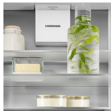
SmartSteel hátsó fal

Lieberr készüléke figyel minden ujjmozdulatára: a Touch & Swipe kijelzőnek köszönhetően intuitív módon és könnyedén kezelheti hűtőszekrényét. A funkciók (pl. „SuperCool”) érintéssel és sepréssel egyszerűen kiválaszthatók a színes kijelzőn. Ugyanilyen könnyen szabályozhatja a hőmérsékletet is. De mi történik, ha éppen nem használja a kijelzőt? Akkor a tényleges hőmérséklet látható rajta.